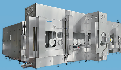
全自动无菌隔离器灌装生产线